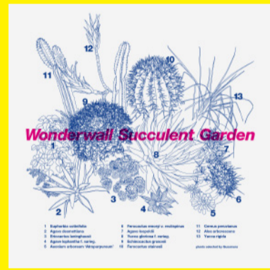
Art Work by Wonderwall Graphic Design Div.