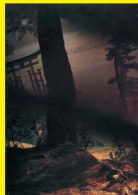
Japan's Scenic Trio -Akinomiyajima