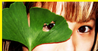
Yes! I see.