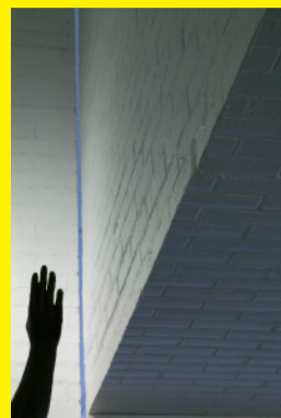
The Aomori Museum of Art